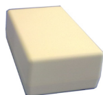
Scheda di varco